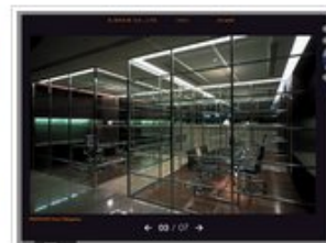
日本办公空间设计欣赏