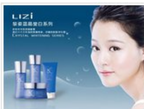
平面周末班优秀学员作品