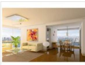
室内设计效果图 客厅电视墙效果图