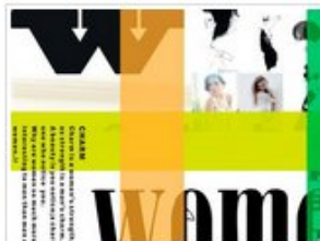
Coreldraw平面设计学员作品