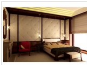
Oleg Kartsev室内设计作品欣赏