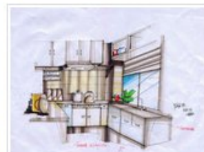
手绘效果图高级班学员作品