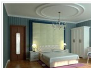
3D室内效果图作品点评