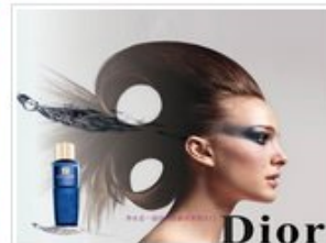
平面广告设计学员作品-化妆品