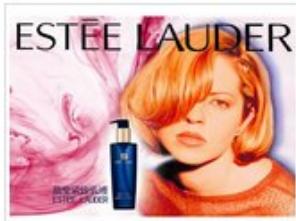
平面设计最新作品