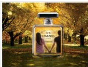
广告设计培训班学员作品