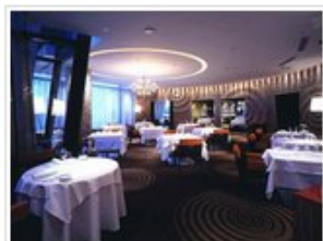
Brain餐厅空间设计效果图